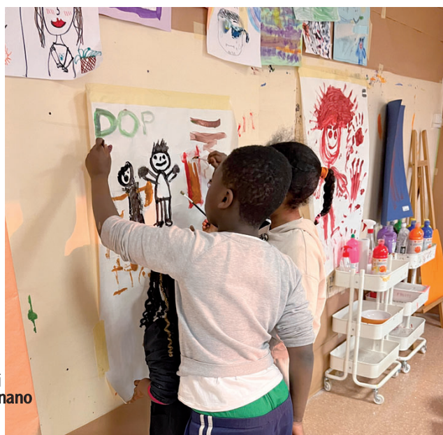
Foto in alto: ospiti della Locanda e in basso i bambini del doposcuola Piccoli Tesori disegnano

3 Modello CU Per chi è esonerato dalla dichiarazione dei redditi in quanto possiede solo redditi di pensione, di lavoro dipendente o assimilati e non è obbligato a presentare la dichiarazione dei redditi.